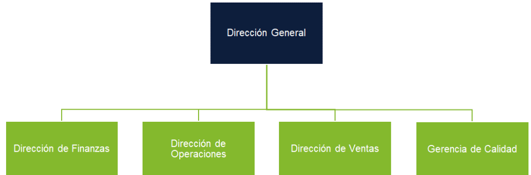
Figura 3. Estructura Corporativa