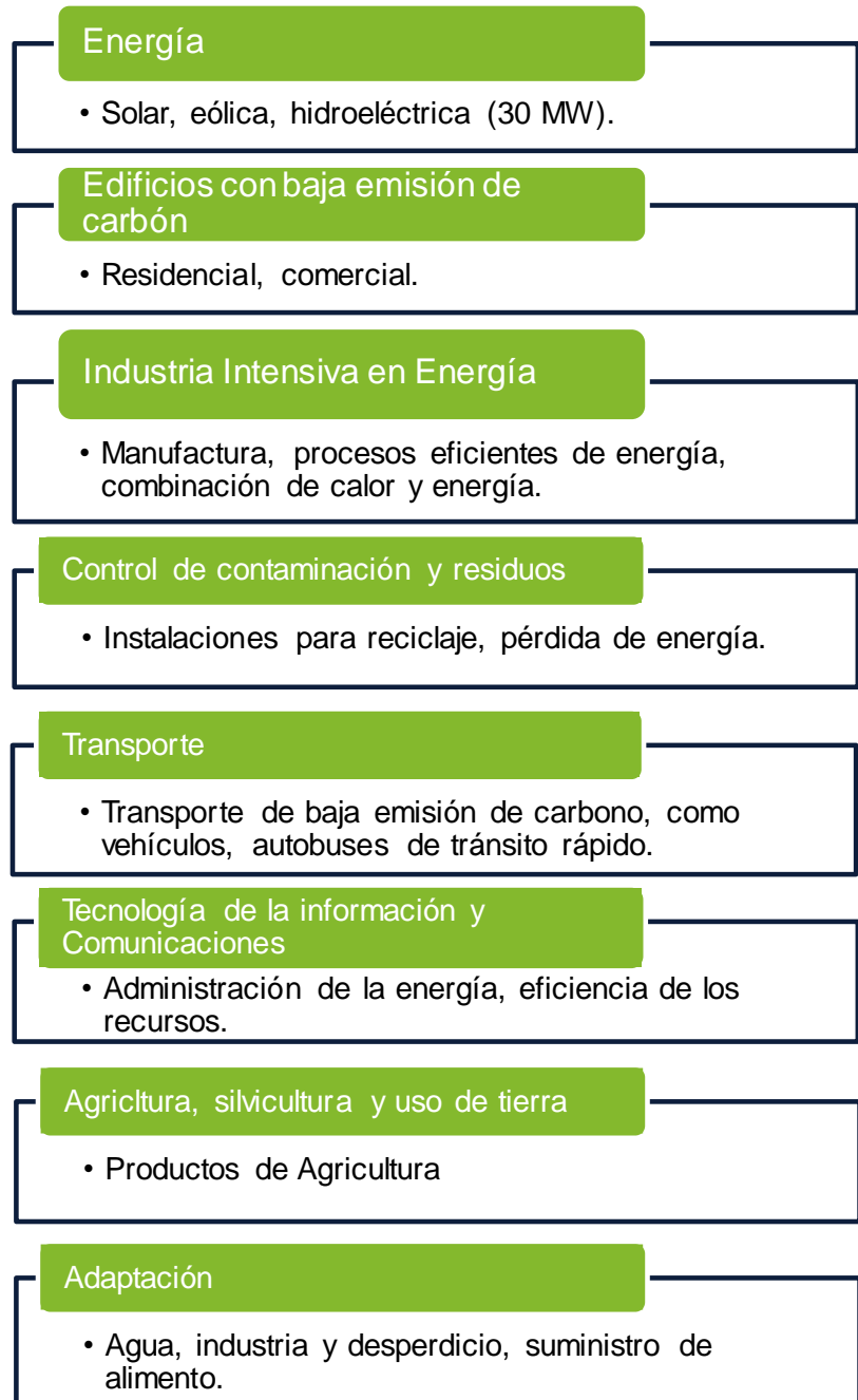
Figura 2: Destino de los recursos