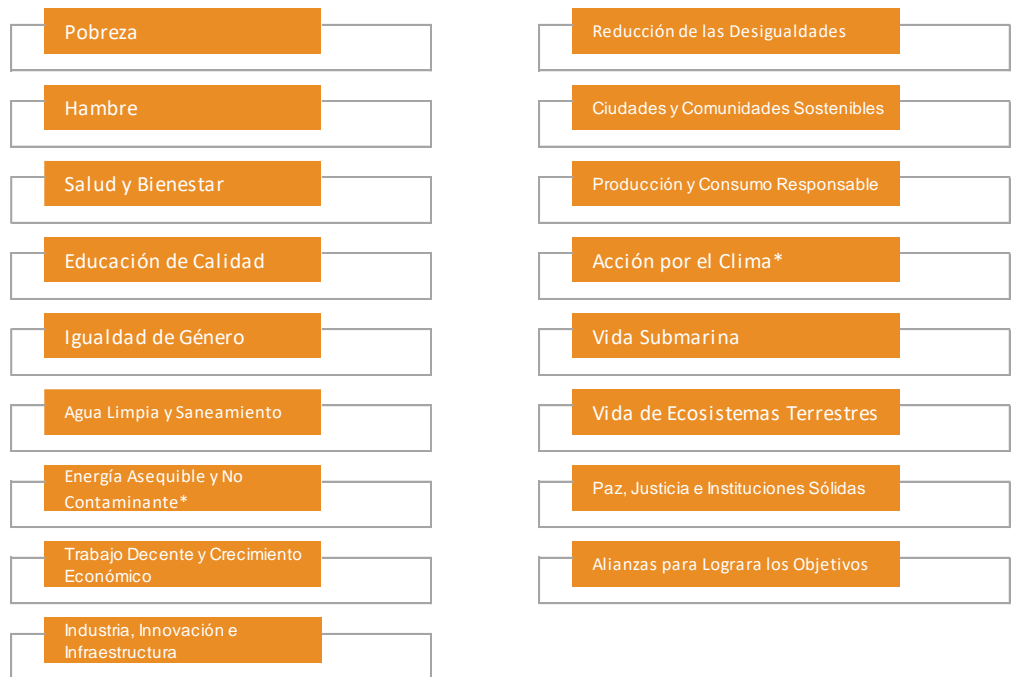
Figura 2. Proyectos Sociales Elegibles

*HR Ratings utilizará sus Criterios de Evaluación de Bonos Verdes (CEBS) cuando el beneficio del proyecto sea reducir emisiones de CO 2 .